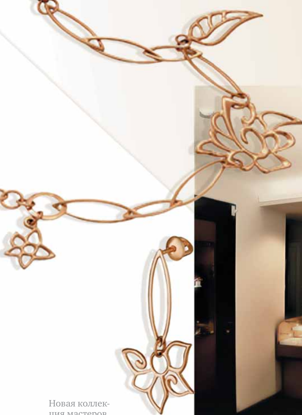
Новая коллекция мастеров Киевского ювелирного завода